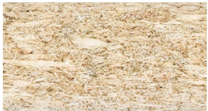
sezione pannello standard

ZOOM I pannelli prodotti con legno vergine di provenienza certificata si riconoscono dal colore interno, più chiaro e nitido e da una maggiore compattezza.